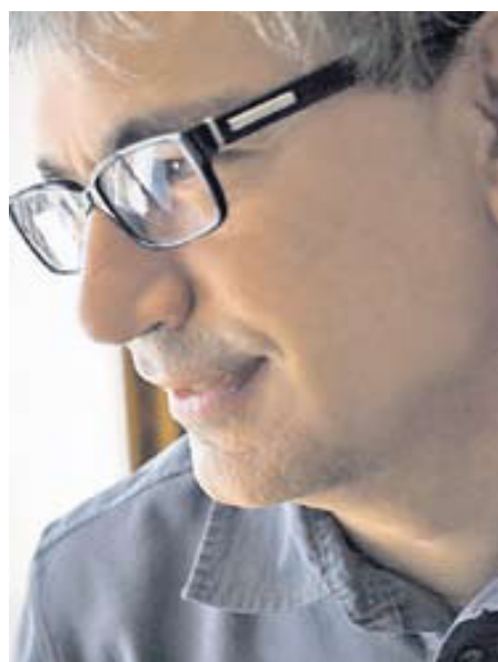
Er hat die Kindheit in der Grossfamilie verbracht. Heute lebt Orhan Pamuk allein.

Haben Sie nie versucht, die Familie zusammenzuhalten? Nein, ich bin nicht dieser Typ. Ich kann nicht das Oberhaupt einer grossen Familie sein. Ich bin ein Einzelgänger. L