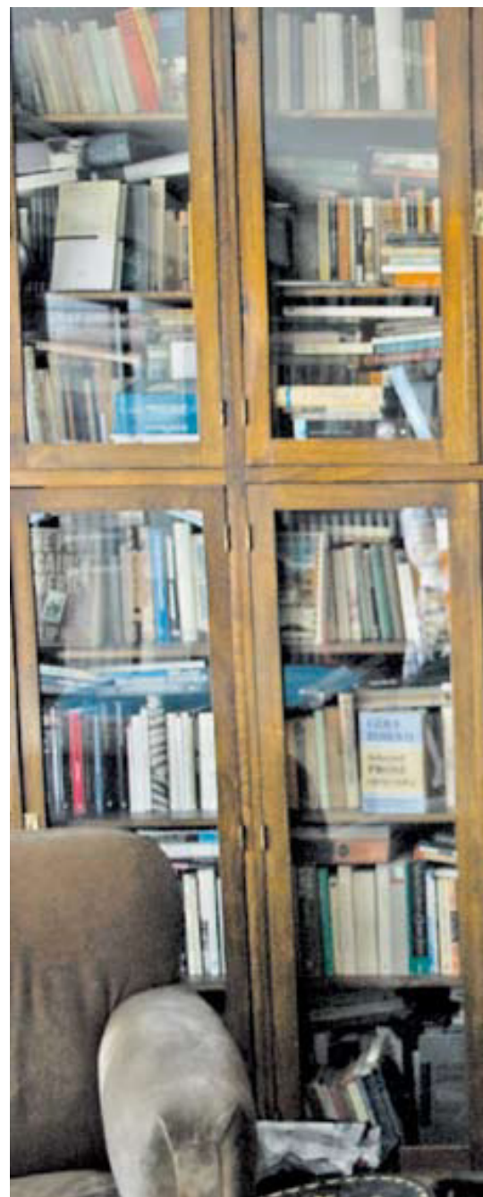
«Ein Leben mit Büchern ist so viel reicher»: Orhan Pamuk, Literatur-Nobelpreisträger, in seiner Stadtwohnung in Istanbul, August 2008.

Seltsamerweise hat ausgerechnet eine islamistische Partei die Türkei näher an Europa herangeführt. Wie erklären Sie dies?